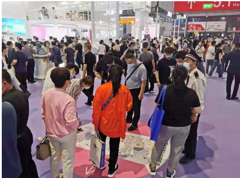
(往届会现场实拍图)