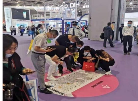
(展位示意图，非现场展位图，以现场最终效果为准)

■ 主办方会在康复养老馆（2.1、1.1 馆）现场地贴上放置展位图地贴，方便观众快速寻找到相关品牌。赞助企业名称 logo 和展位号可在展位图上标注或用 特殊颜色 区别标出，让企业短期内获得高曝光、高流量展示。