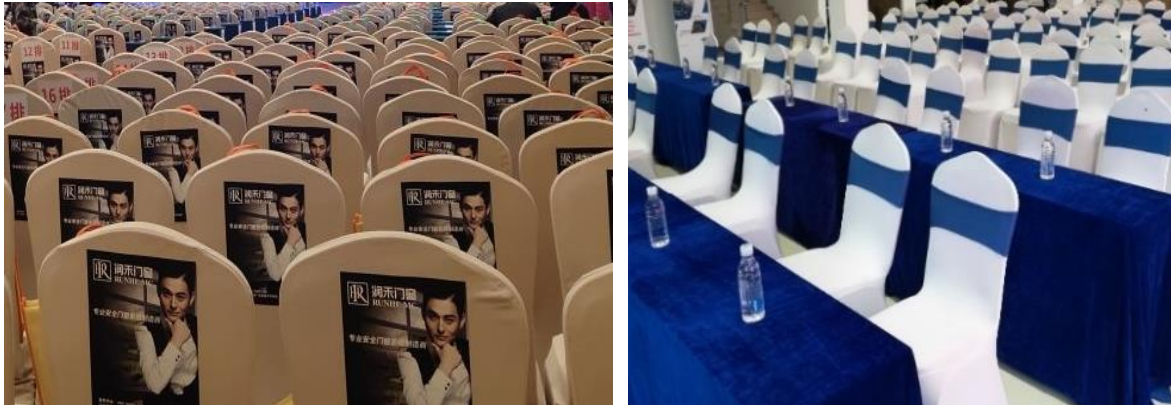
(示意图 以现场最终效果为准)

■会议室内预计摆放会议椅 100-200 把，会期将有数千人次专业观众前往聆听（论坛观众覆盖：行业经销商、代理商；康复中心及综合医院康复科室、养老机构及医养康养机构、社区卫生服务中心、药店诊所、电商微商、体检中心及科研院所等机构）。