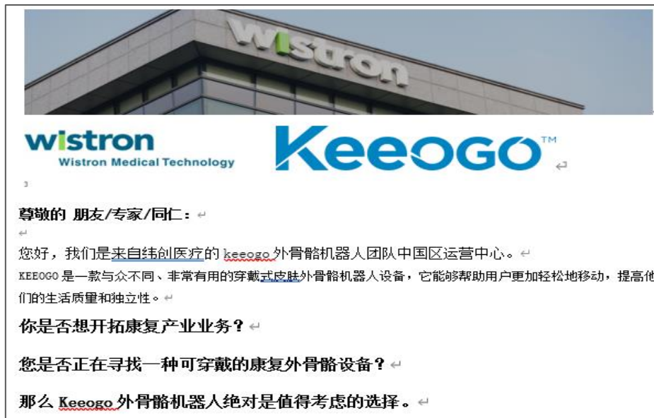
(邮件营销示例截图)

■ CMEF & CRS & CECN 平台拥有百万专业观众数据库, 包括经销商、代理商、采购商、医疗机构、康复中心、养老机构、药店诊所等行业观众, 客户通过定期 EDM 数字营销推广, 可有效增加企业曝光度, 促进业务合作, 为企业带来无限商机。